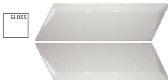
E234343 Lloyd Decor White Left

5,5x19,5 cm. / 2"x8" 8 mm espesor / thickness